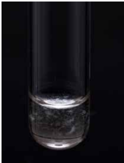
Rysunek 4. Pozytywna aglutynacja H